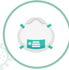
EPIS o mascarillas autofiltrantes

FFP 1 (SIN VÁLVULA DE EXHALACIÓN): Equipo de protección con filtración mínima, no protege a quien la lleva contra organismos infecciosos, pero evita contagios.